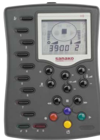
SANAKO Lab 100 -oppilaspaneeli

Ohjelmapankki (Media Storage Unit) on ohjelmavarasto, johon ääniraitoja voi tallentaa ja johon/josta niitä voi kopioida. Kun äänitiedostot on tallennettu ohjelmapankkiin, ne ovat opettajan tai oppilaiden käytettävissä. Suurin tallennuskapasiteetti on mallista riippuen 300-350 tuntia ohjelmatiedostoja. Tätä kapasiteettia voidaan laajentaa käyttämällä jaettuja verkkoalueita.